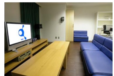
クライアントスペース